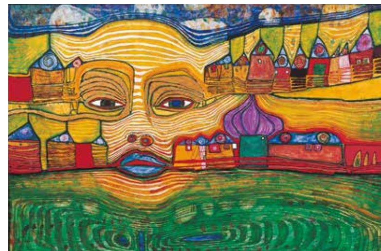
Immersieve expositie 'Hundertwasser, in de voetsporen van de Wiener Secession', opening vanaf 22 april 2022

Bewerking: Cutback. Productie: CULTURESPACES DIGITAL®.